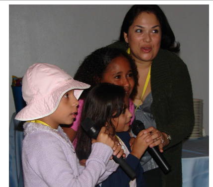
Karaoke en el Primer Encuentro Familiar

Todos los recaudos de La Fundación son para SERVICIO . El trabajo es por voluntarios.