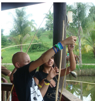
Pescando en Hacienda El Jibarito